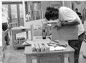
La menuiserie Clément possède la qualification « restauration des menuiseries des monuments historiques »

Autant que possible, les deux entreprises essaient d'utiliser du bois local PEFC, gage d'une gestion forestière durable, une certification que possède la menuiserie familiale d'Unieux. La famille Clément entend bien créer des synergies entre les clientèles de ses deux sociétés, ainsi que sur les achats de matières premières et sur les investissements à venir, qu'il s'agisse d'outillages ou bien de l'achat d'un camion grue neuf. Ces PME de l'Ondaine, installées sur un total de 10 000 m 2 couverts, réalisent un chiffre